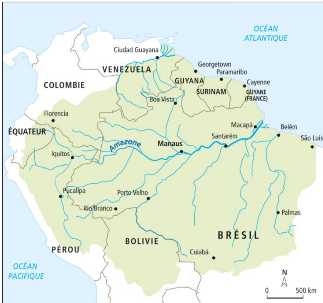
Titre : L'Amazonie, un milieu mis en tension par l'activité humaine